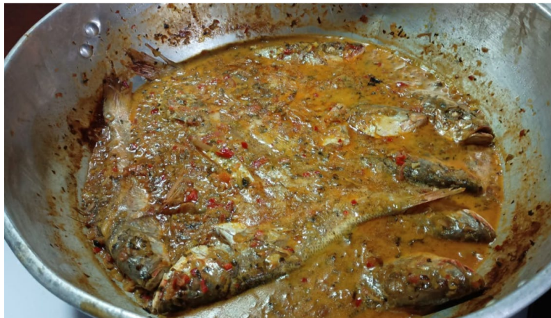
Registros fotograficos de algunas de las preparaciones realizadas con los aprendices de las diferentes fichas 3496221-3519479-3519491-3541722.