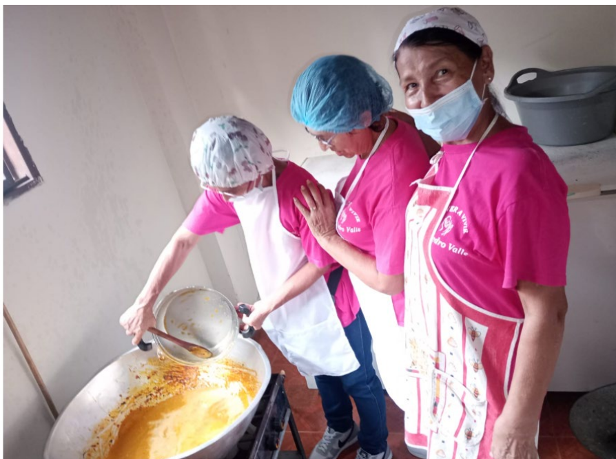
Se desarrolla acompañamiento formativo en el programa: cocina típica colombiana Ficha 3519479