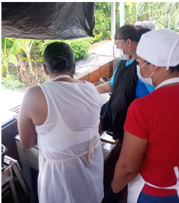
Se desarrolla acompañamiento formativo en el programa: cocina típica colombiana Ficha 3519491